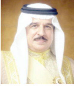
جلالة الملك المفدى

وبهذه المناسبة، كرر وزير التربية والتعليم خالص الشكر وفائق التقدير والاحترام لحضرة صاحب الجلالة الملك حمد بن عيسى آل خليفة عاهل البلاد المفدى حفظه الله ورعاه، على الدعم المتواصل للمسيرة التعليمية في مراحلها المختلفة، مما مكن البحرين من تحقيق المزيد من الإنجازات في العهد الزاهر لصاحب الجلالة الملك المفدى، والتي أكسبتها السمعة الدولية في المنظمات العريقة والمحفلات العالمية. وأشار الوزير إلى أن هذه التحفة، تؤكد اهتمام جلالتهم الكريم بكل ما من شأنه رفعة وتطوير مملكة البحرين في كافة المجالات، وسوف تبقى محل الفخر والإشادة من قبل الوزير وجميع منتسبي الوزارة، ووسام اعتراف دائم لديهم.