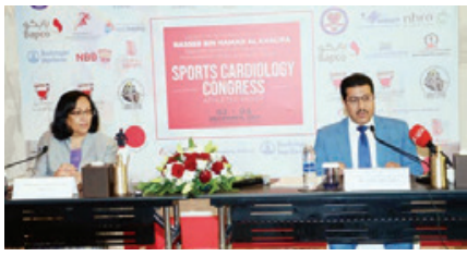
جانب من المؤتمر الصحي.