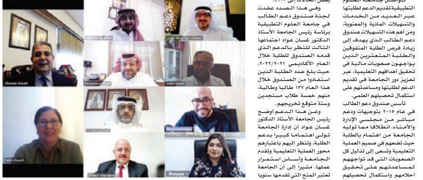
المشاركون في اجتماع لجنة صندوق دعم الطلاب.

تواصل جامعة العلوم التطبيقية تقديم الدعم لطلبتها عبر العديد من الخدمات والتسهيلات المالية والمعونة، ومن أهم هذه التسهيلات صندوق المنح الدراسية الذي يهدف إلى زيادة فرص الطلبة المتفوقين والطلبة المحتشرون الذين يواجهون صعوبات مالية في تحقيق أهدافهم التعليمية، عبر تعزيز دور الجامعة في تقديم الدعم لطلبتها ومساعدتهم على استكمال تحصيلهم العلمي.