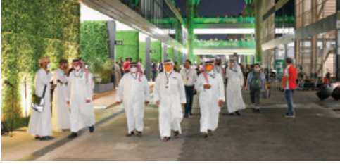
◦ سمو ولي العهد رئيس الوزراء لدى حضوره جانبياً من سباقات النسخة الأولى من جائزة السعودية الكبرى لـ«فورمولا وان» بحلبة الكورنيش في جدة.