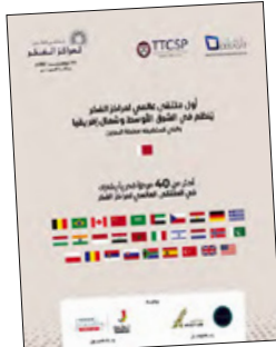
د. الشيخ عبدالله بن أحمد

عن تحدي جائحة كورونا من حيث المنافع والمخاطر، وإمكانات وقوة الشراكات في عالم ما بعد الجائحة، وترسيخ مكانة المرأة في مجالي مراكز الفكر والمشاورات السياسية، وبناء جسور أفضل من صانعي السياسات وعموم المجتمع. يشار إلى أن مركز «دراسات» قد حقق نجاحاً ملحوظاً على قائمة المؤشر العالمي لمراكز الفكر خلال السنوات القليلة الماضية، عندما تقدم بتربيته من المركز 42 في عام 2018 إلى المستوى 23 في عام 2020 على مستوى منطقة الشرق الأوسط وشمال أفريقيا، ومن المركز 11 إلى 7 على مستوى دول مجلس التعاون لدول الخليج العربية في الفترة الزمنية ذاتها. تجدر الإشارة إلى أن الملتقى العالمي لمراكز الفكر سيستهدف مشاركة نخبة من قادة وخبراء بعض أبرز مراكز الفكر العالمية، لتعكس العمل الاستثنائية حرص مركز «دراسات» على تعزيز حضوره