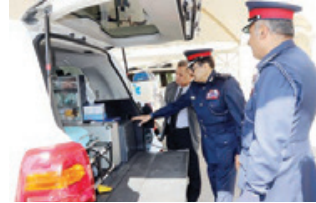
◦ جانب من الزيارة.

من جانبه، أعرب الشيخ حمود بن عبدالله آل خليفة عن اعترازه وتقديره لما لقيه من دعم وساندة أسماها في تسهيل أداء مهامه خلال فترة عمله سفيراً لمملكة البحرين في الرياض، متمنياً للمملكة العربية السعودية دوام الرفعة والتمتع والازدهار.