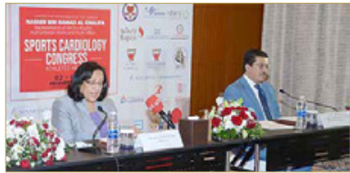
وزيرة الصحة أثناء المؤتمر الصحفي

اعتلال القلب التضخمي سبب الوفيات المفاجئة بالرياضيين وزيرة الصحة: احتضان البحرين للمؤتمر دلالة واضحة على ما يحظى به القطاع الصحي من رعاية رئيس المؤتمر: حالات الوفاة أثناء الرياضة ليست ظاهرة ولا تتجاوز 1 لكل 40 ألف من السكان