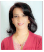
بقلم: الدكتورة هادي عيسى الجرد

القراء الأعزاء أكثر سؤال طرح علي دائما هو ذلك الذي يدور حول كيف أنسي استعطلت حول بين كتابة الشعر بكل ما به عنودية وبحيال وشافية وجمال وبين المسحاحة والعمل الفناني بكل جموده وحيادته ومزارعاته التي تشبهني؟ وسؤالها هو: وما أصفان في أي تجمع من التمسك بالقيم والنهج؟