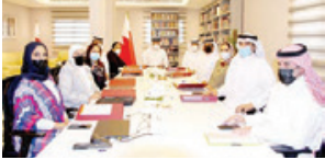
خلال اجتماع معهد التنمية السياسية.

ترأس على بن محمد الرميحي وزير الإعلام رئيس مجلس أمناء معهد البحرين للتنمية السياسية، اجتماعاً للمجلس بحضور أعضاء مجلس الأمناء والمدير التنفيذي للمعهد. وشدد مجلس الأمناء على أهمية تكثيف جهود المعهد في خلال البرامج والفعاليات التوعوية الخاصة بالعملية الانتخابية، وذلك من خلال التعاون مع الجهات صاحبة الاختصاص في هذا المجال، وذلك من خلال التعاون مع الجهات صاحبة الاختصاص في هذا المجال، وذلك من خلال التعاون مع الجهات صاحبة الاختصاص في هذا المجال.