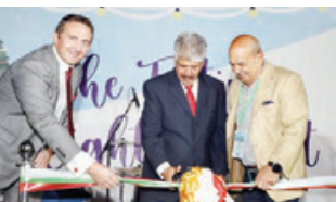
خلال افتتاح السوق الخيري السنوي.