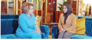
رئيسة مجلس النواب تستقبل نظيرتها الروسية.

وصلت إلى أرض الوطن مساء أمس، وفد برلماني من جمهورية روسيا الاتحادية برئاسة السيدة فلنتينا ماتفينكو رئيسة مجلس الجمعية الفيدرالية للاتحاد الروسي في زيارة رسمية لمملكة البحرين خلال الفترة من ٤ إلى ٦ ديسمبر الجاري، وقأت السيدة فورزيه بنت عبدالله زينتل رئيسة مجلس النواب في مقدمة مستقبلي نظيرتها الروسية وفودت المرافق أعضاء الجمعية الفيدرالية للاتحاد الروسي بمطار البحرين الدولي بحضور النائبين الأول والثاني لرئيسة مجلس النواب، وعند من النواب والأمين العام، وتأتي زيارة الوفد البرلماني بهدف بحث سبل تعزيز التعاون البرلماني والأصلاحي على التحدي، والبرامج المشتركة بين الجانبين وتوقيع اتفاقية للتعاون في المجالات الاقتصادية، ولا سيما في المجال التشريعي والبرلماني.