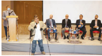
جانب من ندوة حول التعامل العلمي مع الإعاقة.

ترأس مدير عام الإدارة العامة للمباحث والأدلة الجنائية وفد مملكة البحرين المشارك في أعمال الدورة الثالثة للمنتدى الحكومي المخصص لمناقشة تحديات مكافحة جرائم الاتجار بالأشخاص في الشرق الأوسط، والأمن العالمي تحت عنوان «التحديات المشتركة في مكافحة جرائم الاتجار بالأشخاص في ظل جائحة كورونا».