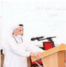
◦ رئيس المجلس الأعلى للصحة.

الورشة تهدف إلى الوقوف على مستجدات البرنامج الوطني لتطوير الرعاية الصحية وتطورات برنامج التسيير الثاني، حيث إن النهوض بالخدمات الصحية وتنفيذ برنامج الضمان الصحي الوطني يتطلب أن تتمتع إدارات المستشفيات ومراكز الرعاية الأولية بالسلطة التي تؤهلهم لاتخاذ قرارات تسم بالضرورة الكاملة لإدارة المؤسسات الصحية لضمان استدامة الخدمات الصحية وأن تكون منظومتها متكاملة ذات جودة عالية ومتاحة لمتلقى الخدمات بكل مرونة وسهولة وسرعة، وأشار الفريق الطبي الشيع محمد بن عبدالله آل خليفة، وادان العام شهد البداية الفعلية بتطبيق نظام التسيير الثاني لتقديم الخدمات الصحية الحكومية، من خلال صياغة المراسيم والقرارات المنظمة لهذا المشروع وتعيين مجالس أسماء المراكز وتعيين تشييديين وبه العمل في مرحلة الهياكل. وأشار إلى أن البرنامج يركز على نظام