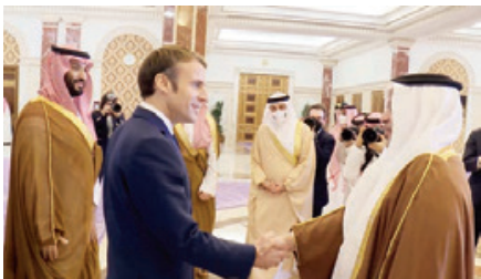
◦ سمو ولي العهد رئيس الوزراء خلال لقاء سمو ولي العهد السعودي ورئيسه الفرنسي.

في إطار الزيارة الأخوية التي يقوم بها صاحب السمو الملكي الأمير سلمان بن حمد آل خليفة ولي العهد رئيس مجلس الوزراء إلى المملكة العربية السعودية الشقيقة، إذ يزور سموه فيها حلبة الكورنيش الأولى من جائزة السعودية الكبرى للفورمولا ١، فقد حضر سموه مأدبة العشاء التي أقامها أخوه صاحب السمو الملكي الأمير محمد بن سلمان بن عبدالعزيز آل سعود ولي العهد نائب رئيس مجلس الوزراء وزير الدفاع بالمملكة العربية السعودية الشقيقة لضيافته. الرئيس إيمانويل ماكرون رئيس الجمهورية الفرنسية الصديقة.